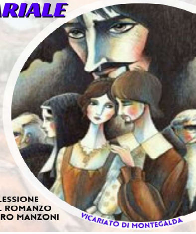
VICARIATO DI MONTEGALDA

GUIDATI NELLA RIFLESSIONE DA ALCUNI PERSONAGGI DEL ROMANZO "I PROMESSI SPOSI" DI ALESSANDRO MANZONI